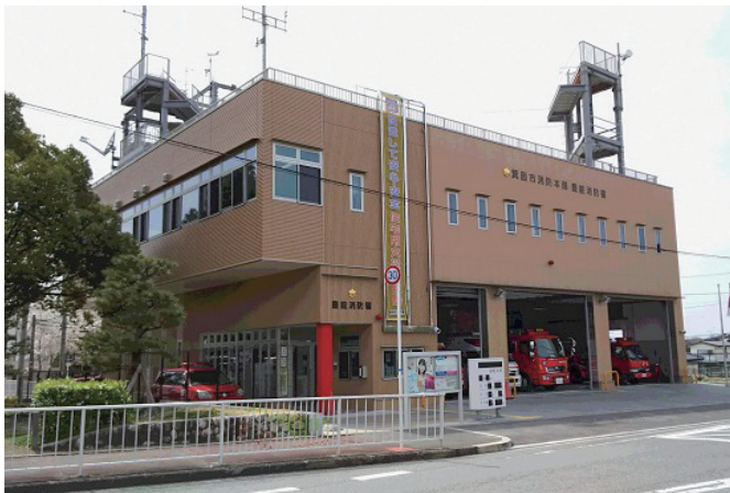
豊能消防署（旧豊能町消防本部庁舎）