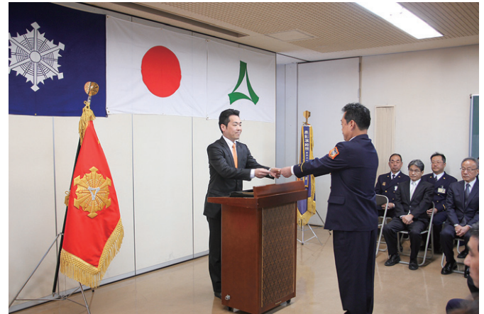
広域化に伴う辞令交付式（市長発令）