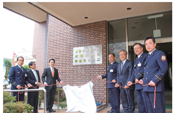
新生「箕面市消防本部」誕生（除幕式の様子）

平成28年4月の消防広域化に伴い新生「箕面市消防本部」として誕生し、広域化の初年度から両市町の全世帯へお伺いする「住宅防火訪問」を実施して、住宅用火災警報器の普及啓発に努めています。今後も、住民目線での消防サービスの向上をめざし、地域住民の安全・安心なまちづくりのため、職員が一丸となり取り組んでまいります。