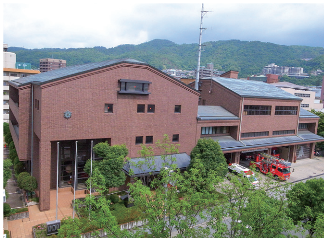
箕面市消防本部・箕面消防署

両市町の管轄区域の安全と安心を担うため、1本部2署2分署1出張所、職員140名が消防業務に従事しています。